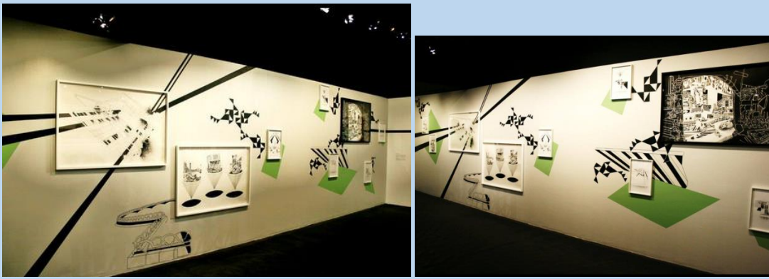
2014 « Vous aussi vous avez l'air conditionné » Galerie Lafayette, Marseille