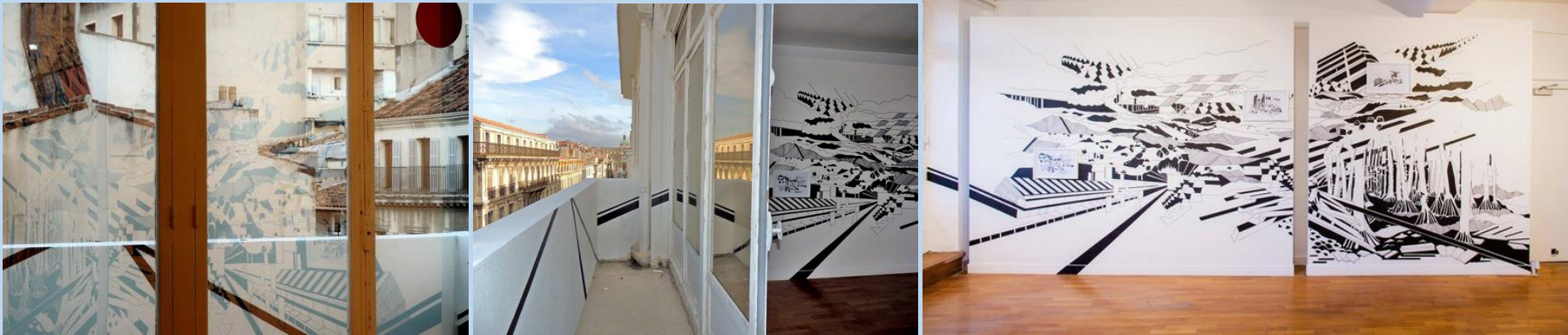
2015 « La terre au milieu des mers » Musée Es Baluers, Palma Di Majorca, Espagne