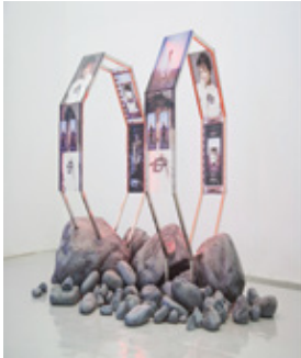
Timur Si Qin, The 8th Gate Sorting Processor, 2015, Plexiglass, metal, resin, paper, LED lights, 285 x 195 x 171 cm

+2 Gallery | Ag Galerie | Aaran Gallery | Azad Art Gallery | Bavan Gallery | Etemad Gallery | Ab/Anbar Art Gallery