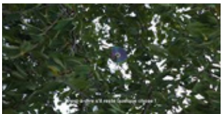
Arash Hanaei, Black Soap, 2020