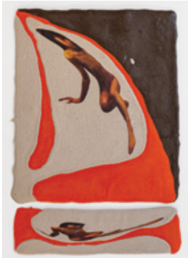
My-Lan Hoang-Thuy, Sans Titre, 2021