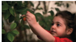
Anahita Hekmat, Green home, 2019, 8'