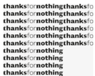
Thanks for nothing Logo